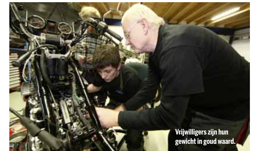
Vrijwilligers zijn hun gewicht in goud waard.

Het zijn vroegtijdige schoolverlaters, jongens die onmogelijk in de schoolbanken passen, jongens met een geestelijke beperking, pubers die in de criminaliteit dreigen te verzinken of die zich wel op een andere manier in de nesten weten te werken. "En die gasten moeten straks aan mijn dure pronkstuk sleute-