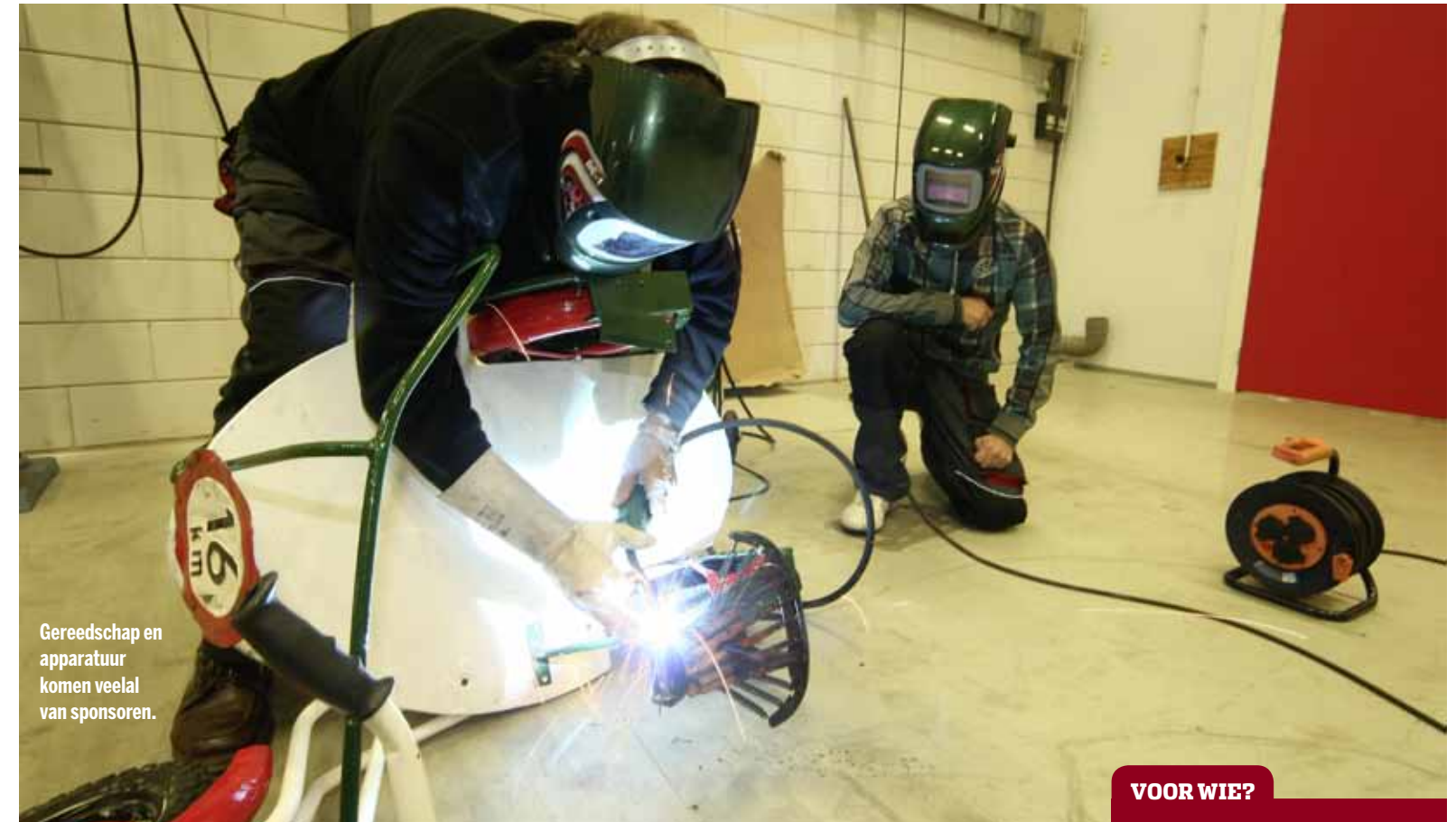
Gereedschap en apparatuur komen veelal van sponsors.

de deuren van zijn professioneel ingerichte werkplaats. De ruimte is er, het gereedschap is er, de motoren zijn er, de leerlingen zijn er, maar wat leren ze? "Je moet het niet te hoog inschatten, voor sommigen is het plakken van een fietsband al moeilijk. We mogen gecertificeerd op drie niveaus opleiden, Leerbedrijf 1 is het laagste niveau. Dan ben je het hulpje van het hulpje. Leerbedrijf 2 leidt op tot motorfietsmonteur en Leerbedrijf 3 tot eerste monteur. Hier doen we vooral niveau 1." Twee deelnemers delen een motorfiets. Hun eigen motorfiets, hun trots en hun ziel en zaligheid waaraan alleen zij mogen werken. Het blinkend oppoetsen maakt prominent onderdeel uit van de lesstof, olie en filters vervangen, tandwielen vervangen, maar sommigen trekken ook gerust het hele blok open om de klepzittingen in te slijpen. "We dagen ze uit: wil je de klepspelings controleren, dan mag dat. Maar dan moet je wel zelf op internet de juiste