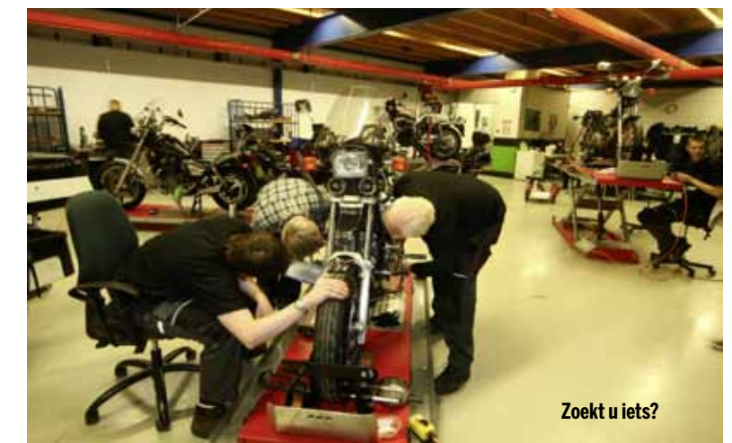
Zoekt u iets?