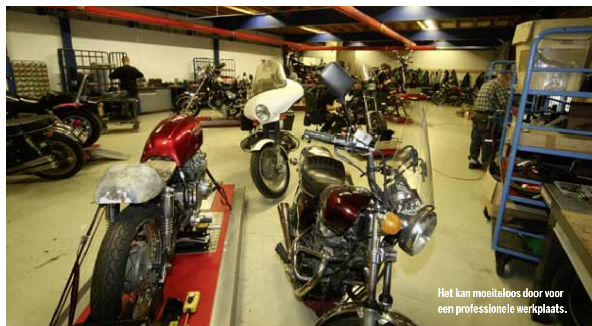
Het kan moeiteloos door voor een professionele werkplaats.