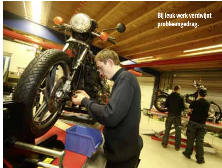
Bij leuk werk verdwijnt probleemgedrag.